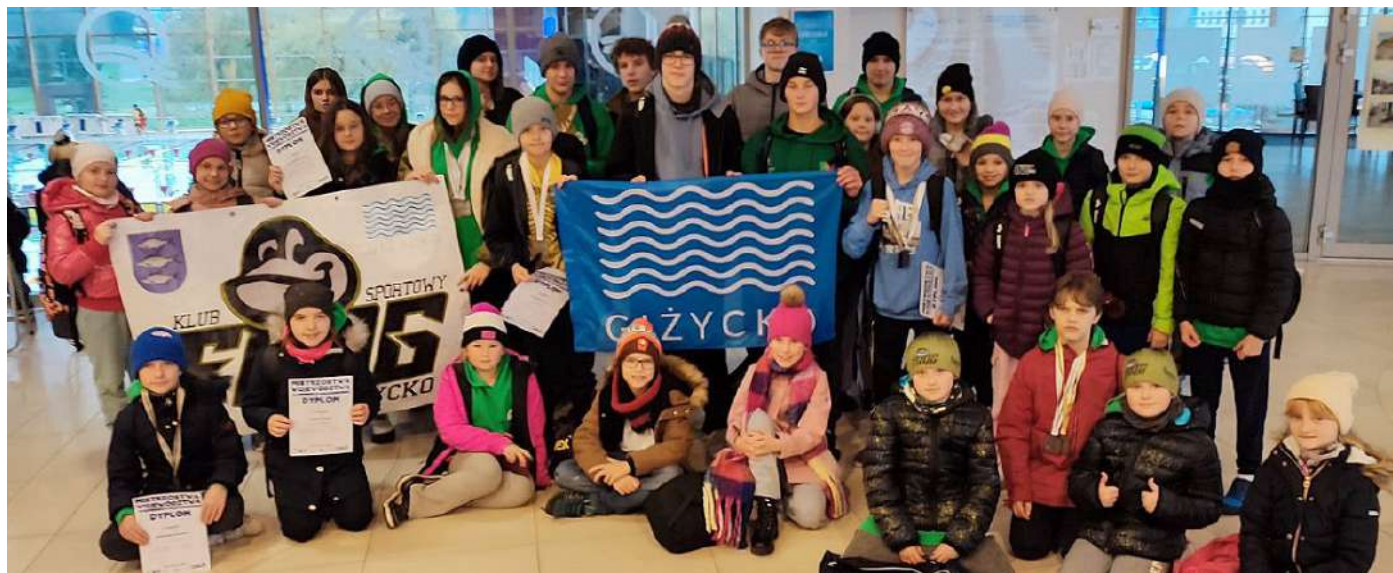
W klasyfikacji drużynowej pływacy UKS Frog zajęli czwarte miejsce w województwie