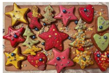
Lukrowane pierniczki - kulinarne arcydzieło Eulalii Paszkiewicz i jej wnucząt